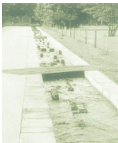
• Le canal : "fil bleu" du centre ville au lac

actuelles et les rendront ainsi plus sûres, plus avenantes. Des espaces de promenade permettront de faire le tour du lac. D'autres espaces, réservés aux piétons, seront aménagés à travers ces espaces paysagés et plantés.