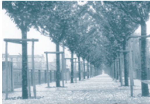
• Le mail arboré : double alignement à floraison et couleurs automnales particulièrement marquées

plusieurs itinéraires seront aménagés, notamment un mail qui bordera l'espace culturel et la bibliothèque, qui constituera l'aboutissement d'une promenade conduisant