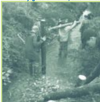
▶ Nettoyage de la Divonne, automne 2003

commune à résoudre un certain nombre de problèmes hydrauliques liés à des ouvrages sous-dimensionnés. Il permettra d'améliorer la qualité des eaux de la Divonne et de valoriser ses milieux aquatiques, tant au niveau piscicole que touristique.