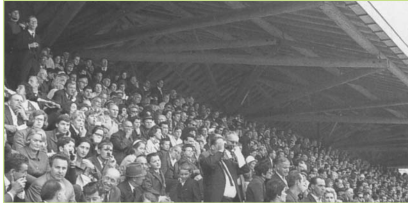
1965 : la foule lors de la première réunion

De par sa mutation, l'hippodrome de Divonne-les-Bains se place merveilleusement dans le nouveau contexte européen, et chacun imagine des chevaux italiens ou allemands disputant l'arrivée.