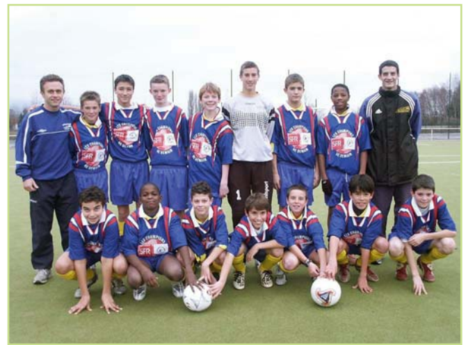
Équipe - de 13 ans USD

Avant toute chose, à l'USD, personne n'oublie et surtout pas son président, que « la pratique d'un sport, quel qu'il soit, permet aux enfants de se sociabiliser et surtout d'apprendre la tolérance et le respect d'autrui. »